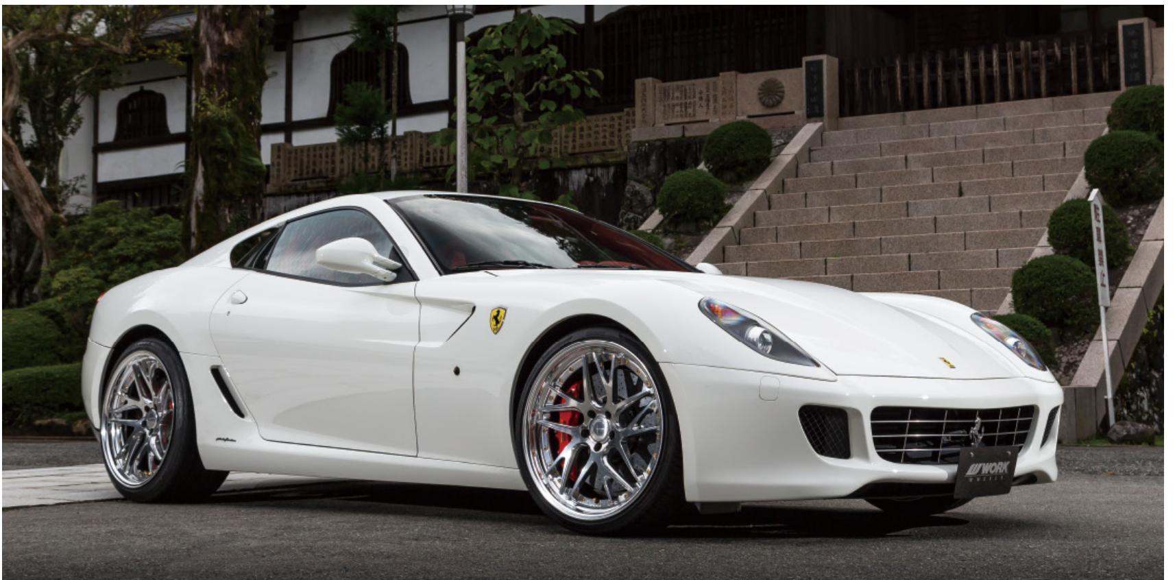
※装着画像はイメージです。