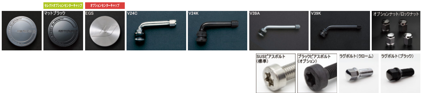
※ラグボルト・ナットの詳細について▶P.262~263