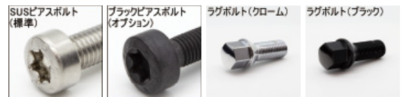
※ラグボルト・ナットの詳細について▶P.262~263