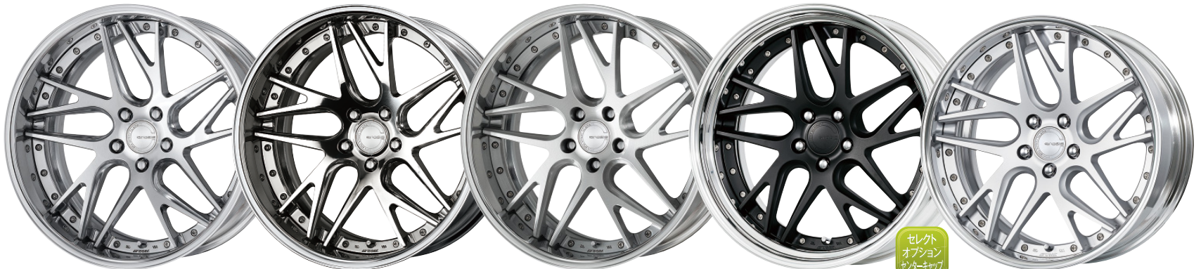
コンビジットパフブラッシュド・PBU 20 (ディープコンケイブ)