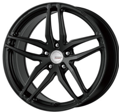
ブラックアノダイズド・SKB 20 (ディープコンケイブ) ブラックエアバルブ仕様 FORGED