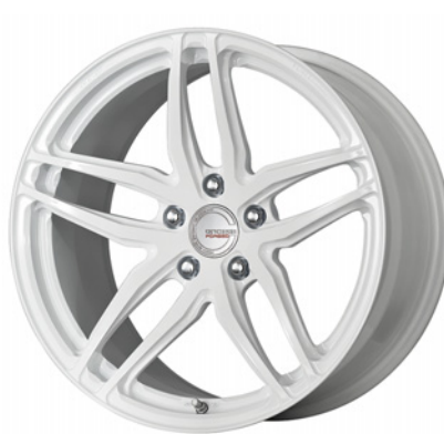
ペイント/ホワイト・WHT 19 (ウルトラディープコンケイブ) FORGED