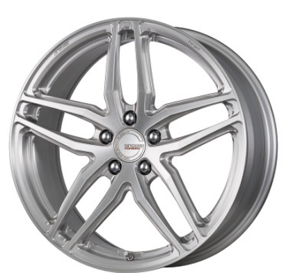
ブラッシュド・BRU 19 (ミドルコンケイブ) FORGED