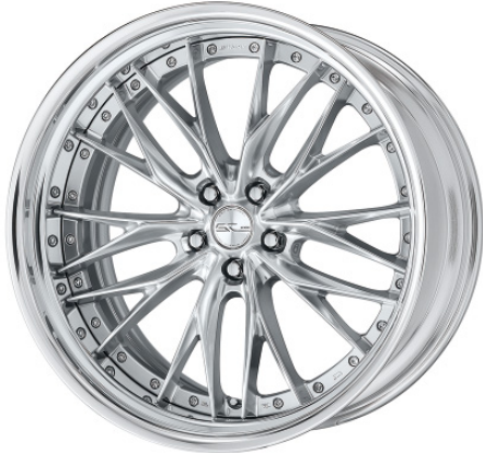
シルキーリッチシルバー・SRS