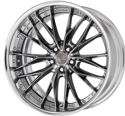
プリリアントシルバーブラック・BSB